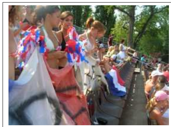
Haut les couleurs.